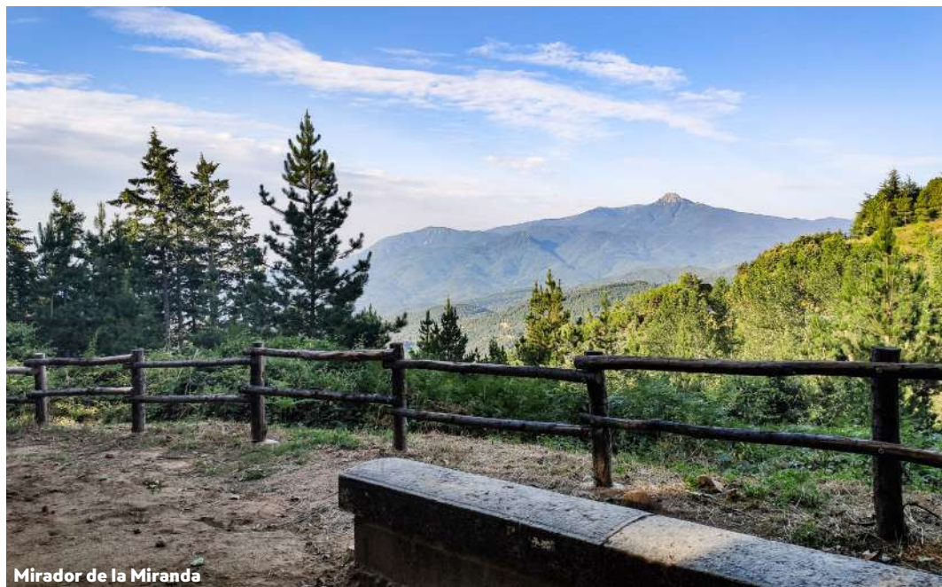
Mirador de la Miranda

Aquest monument megalític en forma de menhir s'atribueix a un grup ètnic i cultural que va entrar pel nord de la península l'any 2000 aC.