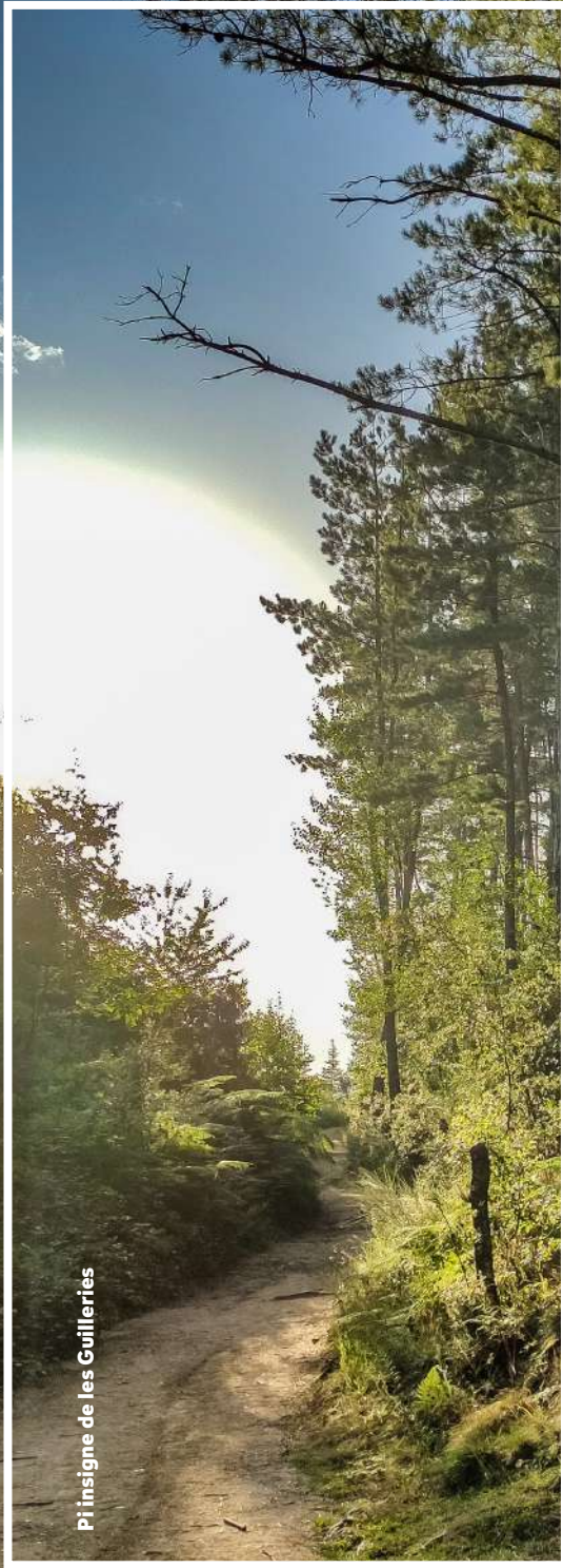
Pi insigne de les Guillerries