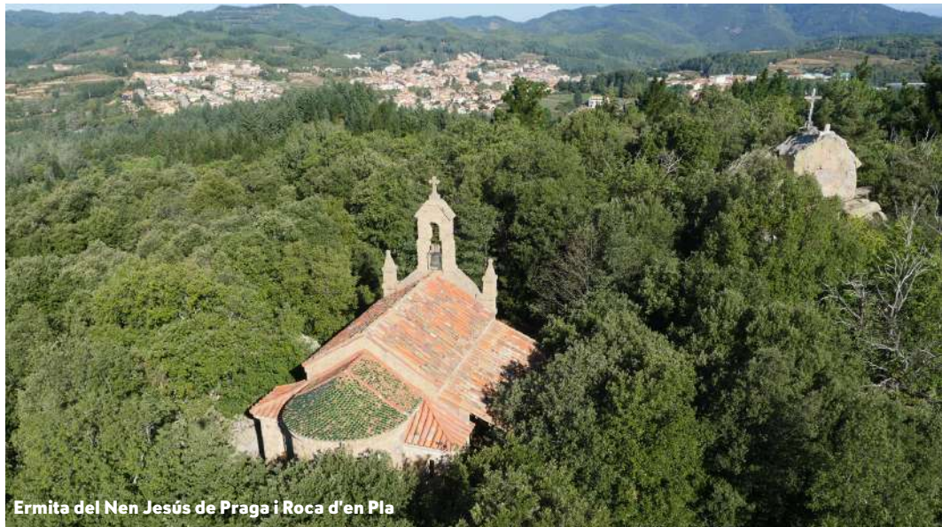
Ermita del Nen Jesús de Praga i Roca d'en Pla

Es diu que aquest va ser l'origen de la fortuna i grandesa de la casa senyorial de Can Rovira.