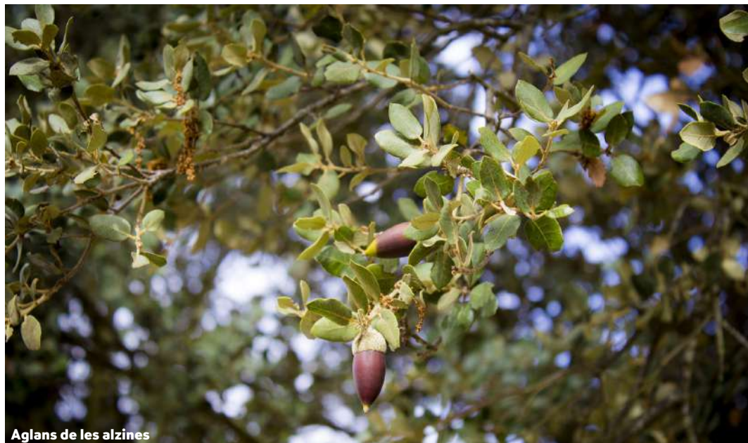
Aglans de les alzines

L' alzina surera té una escorça de suro que la protegeix de la sequera, els incendis i les plagues. Té múltiples usos però és molt ben valorat per la seva qualitat com a tap de vi i cava.