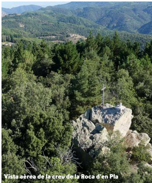
Vista aèria de la creu de la Roca d'en Pla

Va esclarissarlo amb la mà per veure si hi havia alguna cosa més i va observar quatre puntets