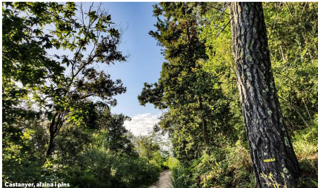
Castanyer, alzina i pins

El seu fruit és una pinya gairebé rodona que creix de forma vertical cap amunt. Es planta principalment per motius ornamentals tot i que a vegades també per motius de repoblacions forestals.