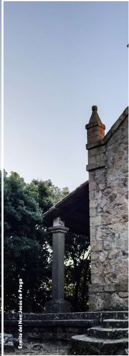
Ermitta del Nen Jesús de Praga