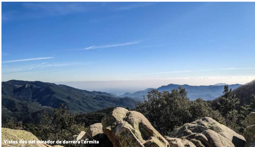
Vistes des del mirador de darrera l'ermita