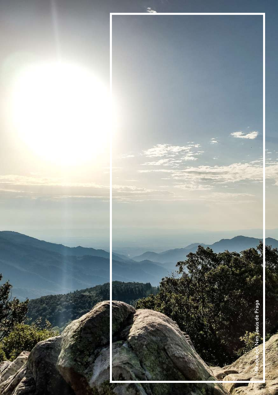
Mirador de Nën Jesús de Praga