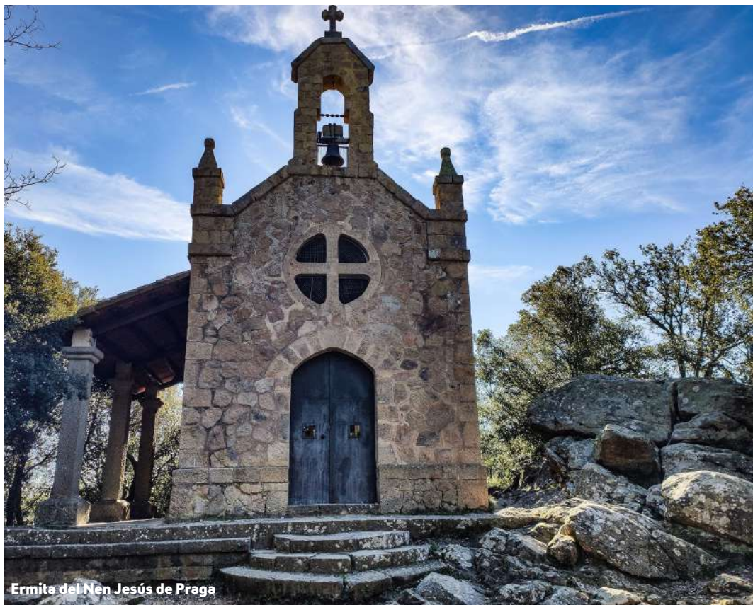
Ermita del Nen Jesús de Praga

El motiu pel qual a Sant Hilari hi ha una ermita dedicada al Nen Jesús de Praga és perquè a Espanya en general es venerava molt , però no hi havia cap indret dedicat a aquesta figura.