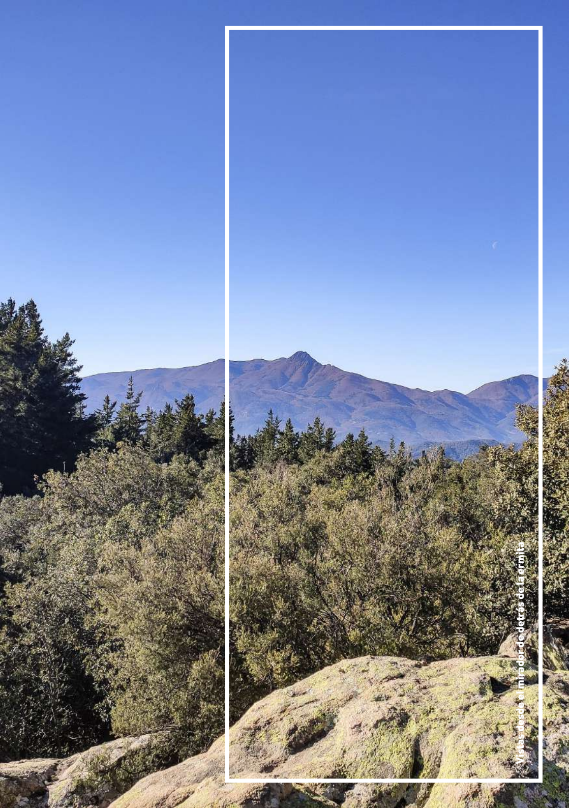
Vista desde el mirador de detrás de la ermita