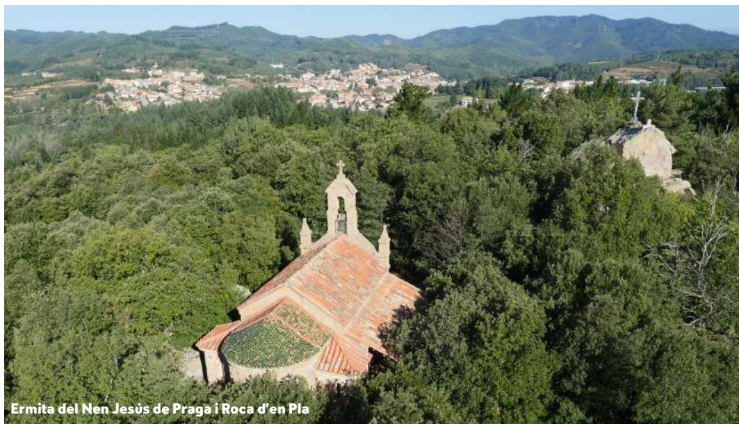
Ermita del Nen Jesús de Praga i Roca d'en Pla

"Can Rovira era la casa solariega más fuerte y grande de la villa. Desde siempre hasta hace pocos años, en morir la última mujer superviviente de la familia, el día de Corpus se ponían un mantel en el altar que había delante de la casa. La leyenda dice que este mantel era de los "Encantats", que vivían en un palacio bajo tierra, cerca de un paraje conocido como Roca d'en Pla. Estos seres pequeños y mágicos dejaban el mantel en las rocas para que se secaran y un día el heredero de Can Rovira que pasaba por allí, pensó en cogerlas y huyó corriendo. Los "Encantats" lo vieron y lo persiguieron hasta casi cogerlo, pero las campanas de Sant Hilari repicaron toque de ánimas. Los "Encantats" se detuvieron y gritaron muy fuerte: "Cuida y guarda bien este mantel, ya que todo aquel que las conserve nunca podrá ser pobre". Se dice que este es el origen de la fortuna y grandiosidad de la casa de Can Rovira."