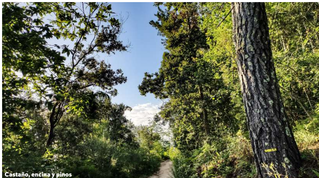
Castaña, encina y pinos

Su fruto es una piña casi redonda que crece de forma vertical hacia arriba. Se planta principalmente por motivos ornamentales , aunque a veces también por motivos de repoblación forestales.