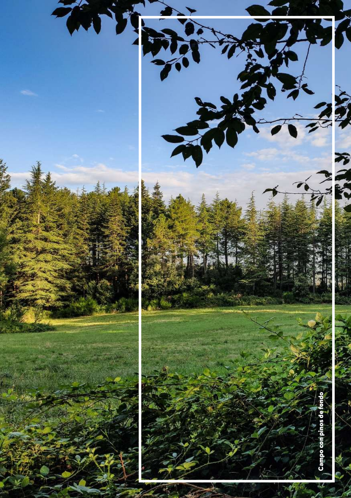
Campo con pinos de fondo