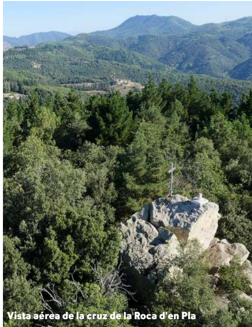
Vista aérea de la cruz de la Roca d'en Pla

Un día una muchacha del pueblo entró en la cueva y salió con el delantal lleno de alguna cosa. Evidentemente conocía la historia, y sabía que no lo podía mirar aun, pero su curiosidad la traicionó antes de llegar al riachuelo. Así pues, observó una gran cantidad de centeno (cereal parecido a cebada o trigo).