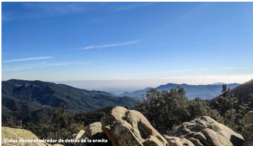
Vistas desde el mirador de detrás de la ermita